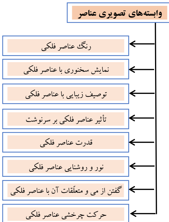
شکل ۱- وابسته‌های تصویری عناصر فلکی در شعر زلالی خوانساری بر اساس یافته‌های پژوهش