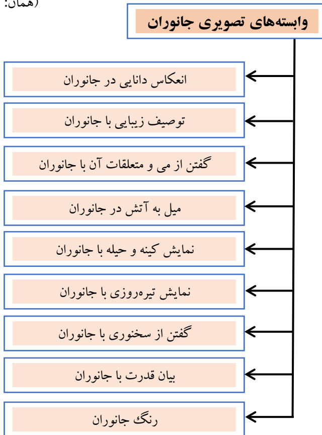
شکل ۲- وابسته‌های تصویری جانوران در شعر زلالی خوانساری بر اساس یافته‌های پژوهش

بر خنک شکوفه، تازیانه بر سنبل و ژاله، دام و دانه (همان: ۳۶۳)