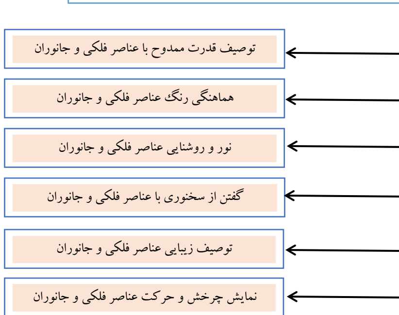
شکل ۳- وابسته‌های تصویری مشترک میان عناصر فلکی و جانوران در شعر زلالی خوانساری بر اساس یافته‌های پژوهش