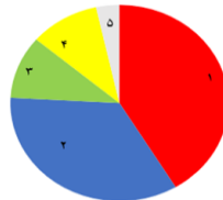
نمودار میزان کاربری حس آمیزی در سقط‌الزند